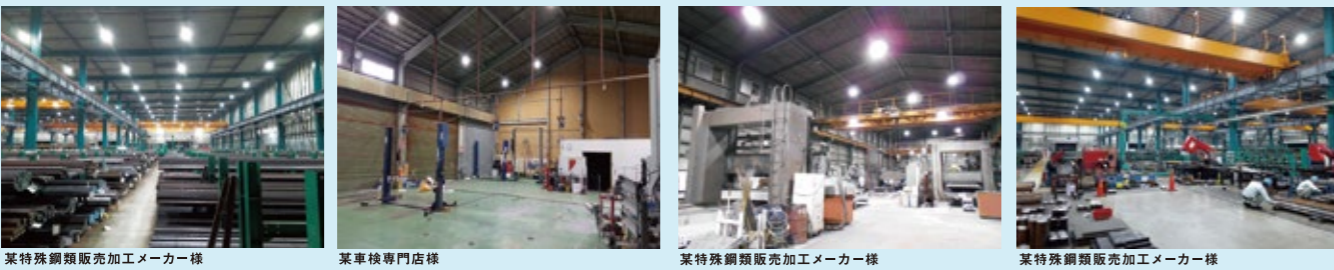
某特殊鋼販売加工メーカー様 某車検専門店様 某特殊鋼販売加工メーカー様 某特殊鋼販売加工メーカー様