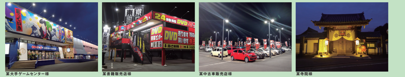
某大手ゲームセンター様 某書籍販売店様 某中古車販売店様 某寺院様